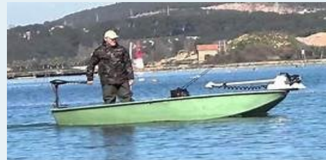
Barques de pêche-promenade électriques,