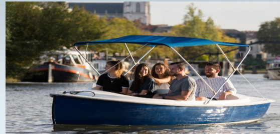
Bateaux électriques de 4/5 places, à louer à l'heure, à la 1/2 journée ou journée.

Des équipements nautiques, très divers & de qualité, sont indispensables pour l'avenir du bassin de vie de Villeneuve !