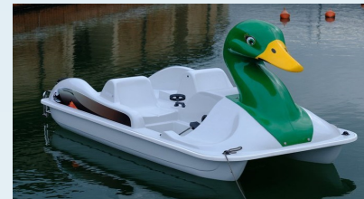
Différents pédalos à 2, 4 et 5 places, à l'heure & 1/2 journée.