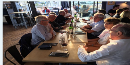
Bar-clubhouse accueillant, pour le lien social.